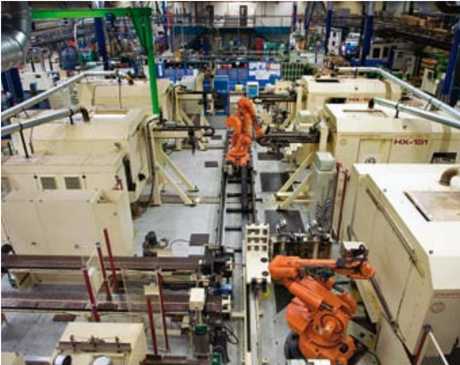
Lemont utför sina legoarbeten med en modern och omfattande maskinpark som täcker de flesta områden och behov inom metallbearbetning. Det handlar om skärande bearbetning, plåt- och svetsbearbetning samt konstruktion. Produktionen omfattar såväl små som stora detaljer, i enstyckeserier och i större serier.

LEMONT AB ARBETAR MED legotillverkning inom affärsområdena Energi, Skog och Industri.