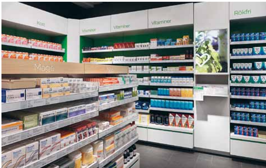
Apoteket använder AM Avvikelse bland annat för att hålla ordning på godkännandeprocesserna för egenvårdsprodukter som genomgår hårda kvalitetskrav innan de slutgiltigt godkänns för att ingå i Apotekets sortiment.

Den svenska apoteksmarknaden har kraftigt förändrats. Nu är konkurrensen hård om kunderna. Apoteket är fortfarande störst, men nya aktörer som exempelvis Medstop har gett sig in i kampen. Båda apotekskedjorna har valt AM Avvikelse som ärendehanteringssystem.