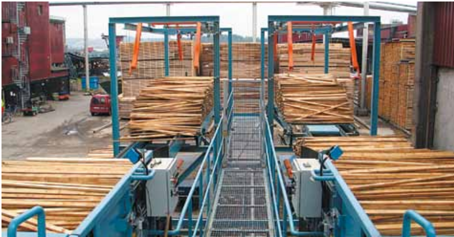
Sågverket i Valåsen är Moelvns största sågverk. De har valt att outsourca all service och underhåll till YIT. Valåsen producerar både furu och gran av båda grovt och klennt timmer till stora och små kunder för en rad olika användningsområden.

Att implementera ett nytt underhållssystem behöver inte vara svårt och ta lång tid.