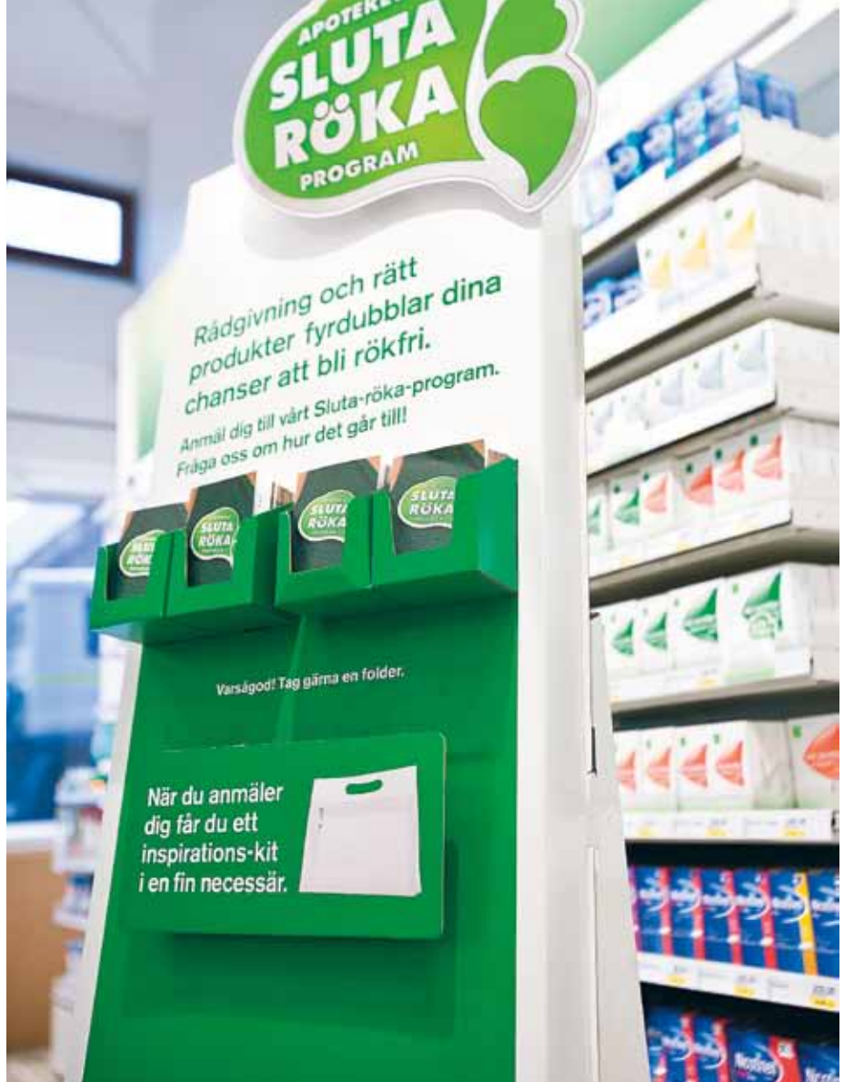
Apotek är visserligen inte i monopol längre, men Apoteket är fortfarande landets största apotekskedja med sina 330 apotek i hela landet.

Apoteket började med AM Avvikelse i september 2008. Att systemen är webbaserade är viktigt för Apoteket eftersom det ökar tillförlitligheten. Det tekniska ansvaret hamnar på AM System när systemen ligger på AM Systems serverar.